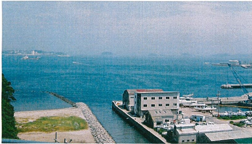
遠くに渥美半島伊良子岬、近くに師崎港