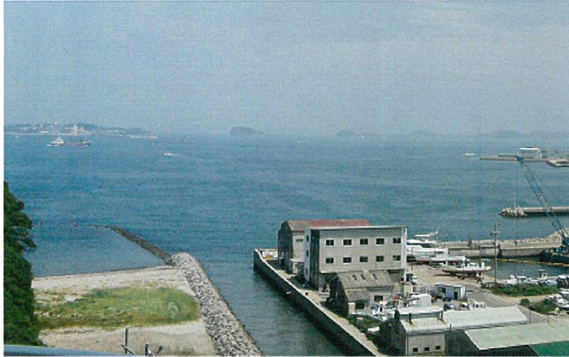
遠くに渥美半島伊良子岬、近くに師崎港