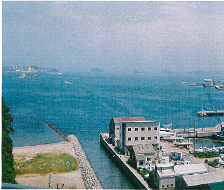
遠くに渥美半島伊良子岬、近くに師崎港