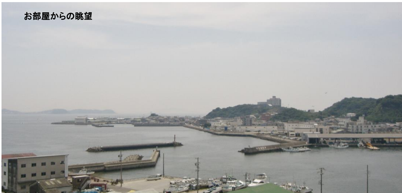
お部屋からの眺望