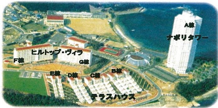
お部屋からの眺望