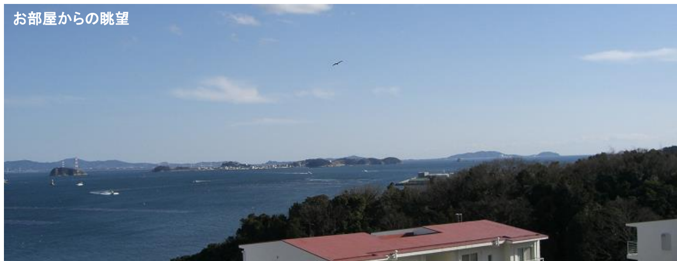
お部屋からの眺望