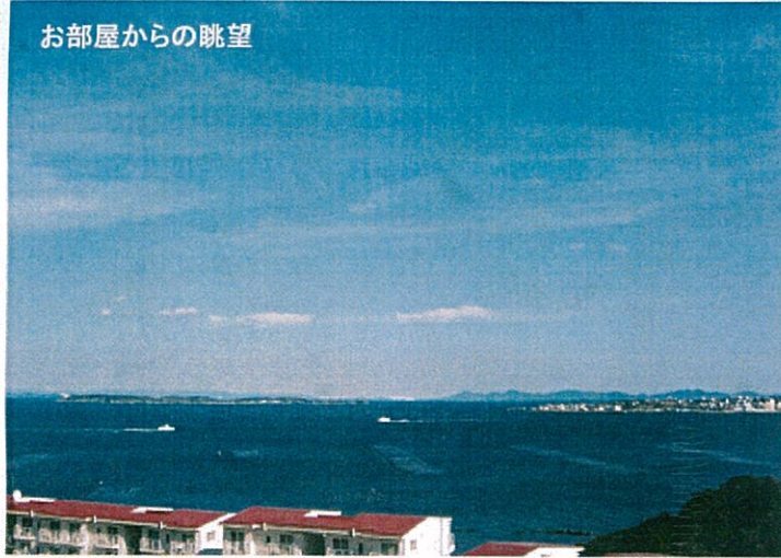
お部屋からの眺望