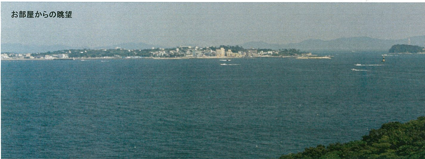
お部屋からの眺望