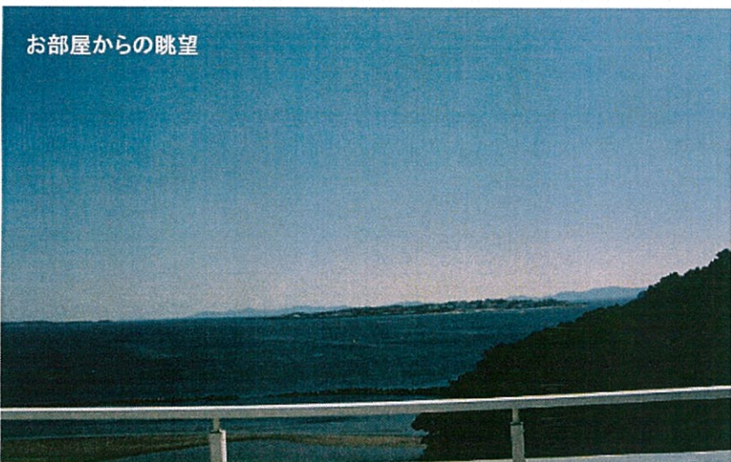
お部屋からの眺望