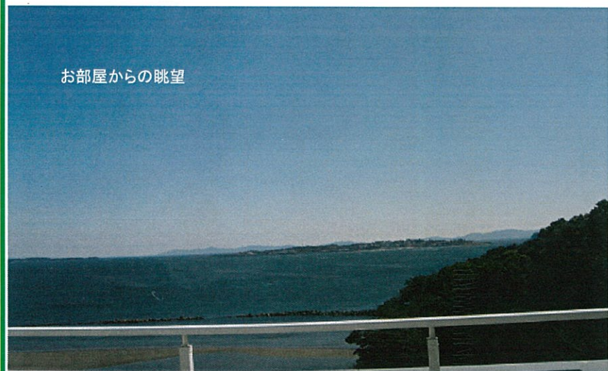
お部屋からの眺望