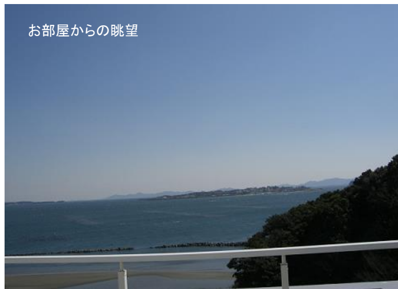
お部屋からの眺望