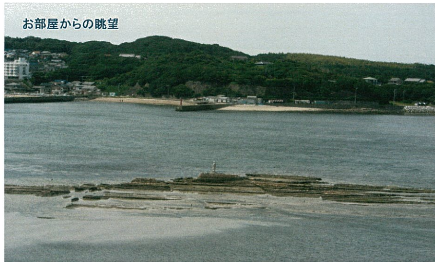
お部屋からの眺望